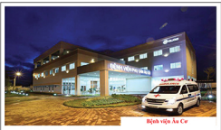
Bệnh viện Âu Cơ