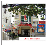
UBND Bình Thuận