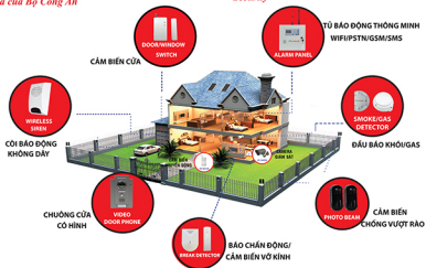
Hệ thống thiết bị an ninh Picotech Picotech Security Systems & Surveillance

Caution: Stub goods products have Anti-counterfeit stamp of the Ministry of Public Security